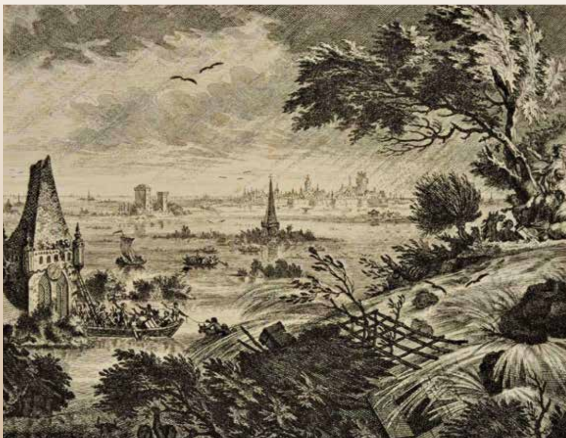
Gravure van de Sint-Elisabethsvloed van 18 november 1421, met een dijkdoorbraak en de overstroming van de Grote Waard. In de verte is Dordrecht te zien. Gravure door S. Fokke, uit: J. Wagenaar, Vaderland-sche Historie, deel III (Amsterdam 1770) 34. Gebundeld in het Dordracum Illustratum .

werd geschilderd, laat zien hoe het water zich tussen de hoogten een weg baande. Bij eb zakte het water natuurlijk steeds een meter of wat. Ondanks de herhalingen van wateroverlast in 1422 en 1423, en voor de tweede grote vloed in 1424, was er voldoende gelegenheid om zelfs interieurs uit huizen en kerken, ►