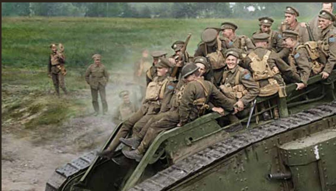
Scène uit They Shall Not Grow Old . Op weg naar het front met een tank.

Het wordt echter niet geheel duidelijk om welke slag het hier gaat. Dit is een logisch gevolg van het feit dat Peter Jackson niet geprobeerd heeft de ervaring van de oorlog vanuit het perspectief van