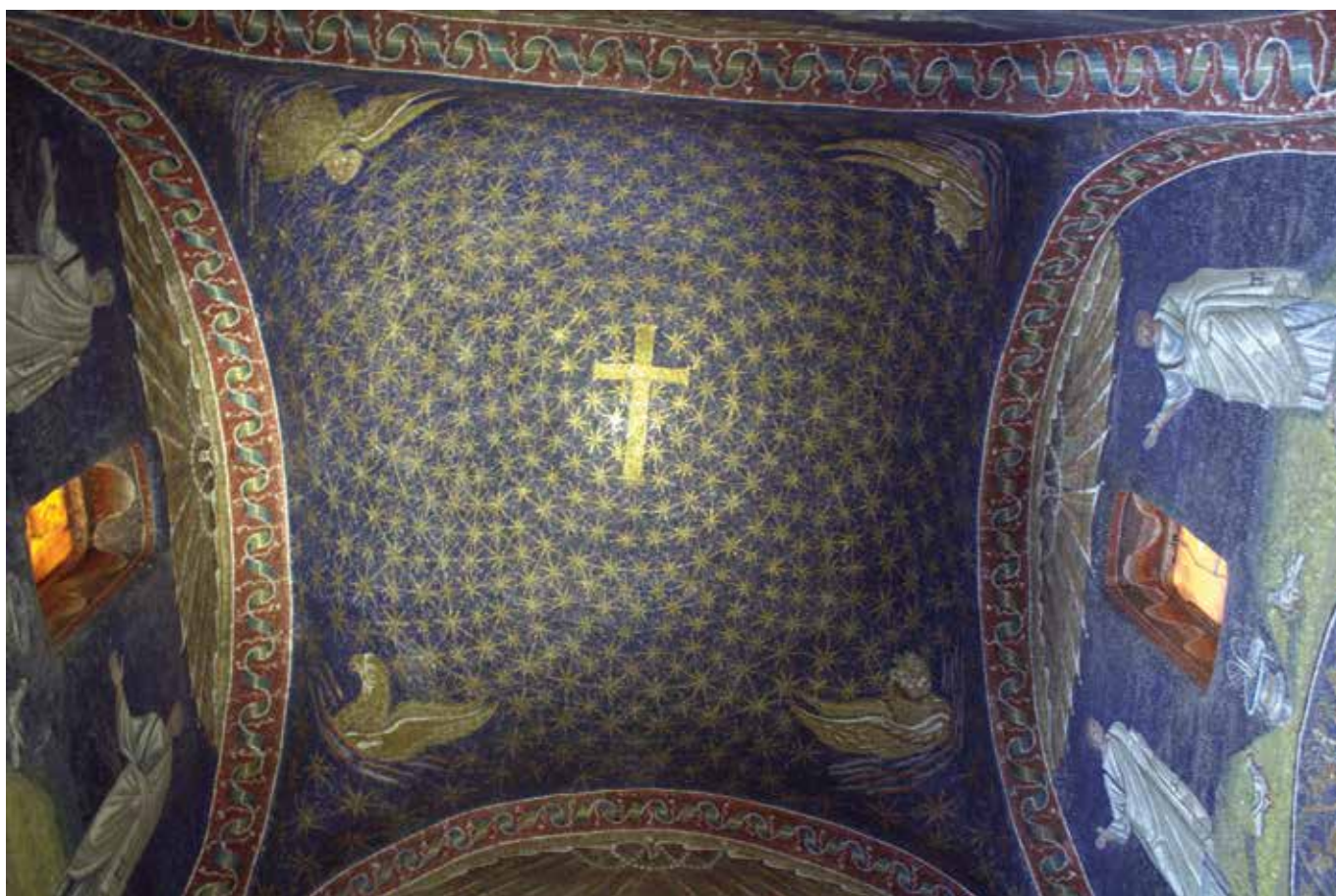
Kruis zwevend tussen sterren in de koepel van het mausoleum van Galla Placidia in Ravenna.

traditie, die talrijke rituelen legitimeert, ook zij geloven 'op hun manier' in de Sint. Oneindig veel breder was het spectrum van het antieke 'geloven' in goden.