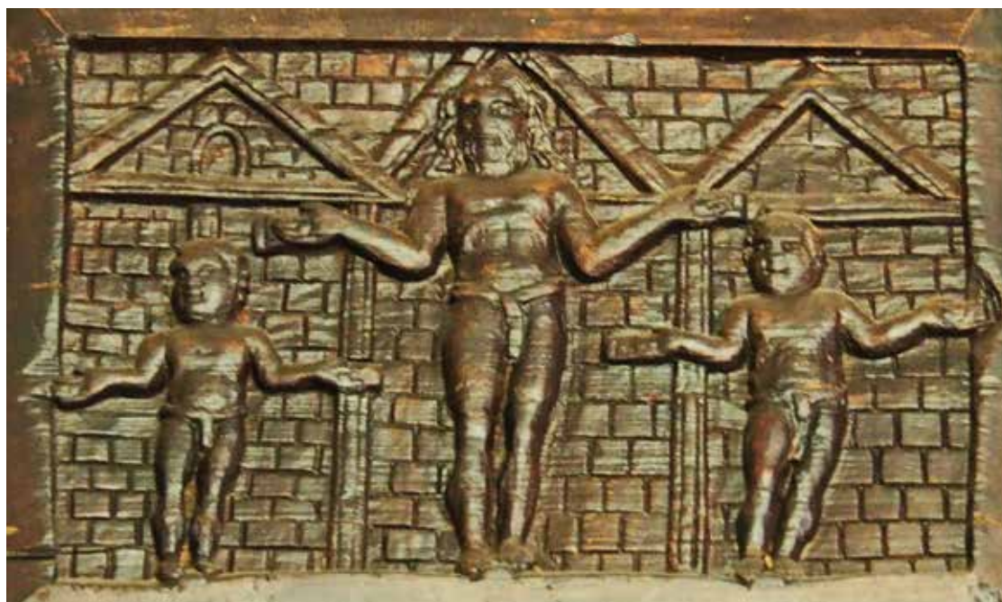
Een paneel op de deur van de Santa Sabina in Rome stelt de kruisiging van Christus voor, ca. 430.

'Het is geloofwaardig omdat het absurd is.' Zo verontschuldigt de apologet Tertullianus zijn geloof in de menswording van Gods zoon. Er was inderdaad flink wat intellectueel masochisme nodig om de christelijke leerstellingen aan te nemen. Een god die zijn zoon de wereld in zond, maagdelijke verwekking en geboorte, dood aan het kruis, gevolgd door opstanding. In het bijzonder de kruisdood was volgens het woord van Paulus (1 Kor. 1:23) een 'ergernis ( skandalon ) voor de Joden, een dwaasheid ( moría ) voor de heidenen'. Kruisiging was immers de straf voor misdadigers van het laagste allooi, struikrovers en dergelijke; Romeinse burgers werden tenminste fatsoenlijk onthoofd. Een sterke kerel kon dagenlang aan het kruis hangen te verrekken tot voldoening van de