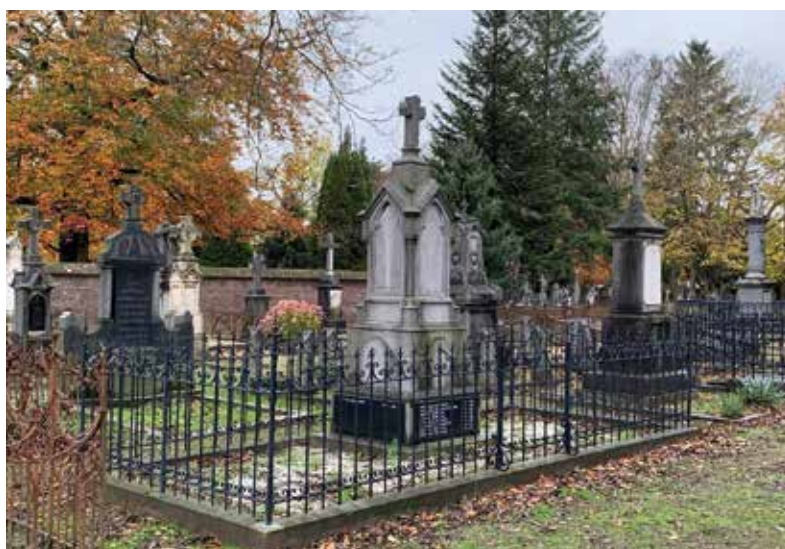
Het eerste klassegedeelte van begraafplaats Nabij Kapel in 't Zand, 2020.

Aangestuurd door kijkopdrachten nemen de leerlingen de concrete werkelijkheid waar in de vorm van grafmonumenten en graven in de verschillende negentiende-eeuwse begraafklassen. De leerlingen stellen al rondlopend, aandachtig kijkend en met hun eigen groepje overlegend en samenwerkend per begraafklasse vast hoeveel ruimte er per graf beschikbaar is, hoe groot de grafmonumenten zijn, of het gaat om graven voor meer personen (familiegraven) of niet, van welk soort materiaal ze gemaakt zijn, of ze veel tekst of kunstzinnige afbeeldingen bevatten en zo ja, of die verwijzen naar beroepen of maatschappelijke