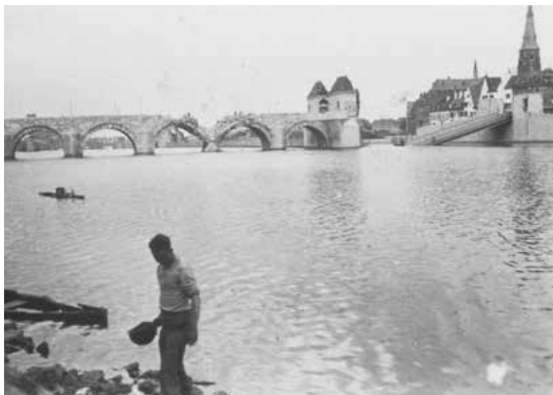
Afro-Amerikaanse soldaat aan de oever van de Maas bij Maastricht. Op de achtergrond de bekende Sint Servaasbrug.

All Black Tank Battalions actief, zoals het 784e dat Venlo bevrijdde en het 761e dat vocht in de Battle of the Bulge . Ook bij de infanterie vochten zwarte Amerikanen mee. Het Amerikaanse leger had namelijk in Normandië en in de Ardennen zoveel infanteristen verloren dat ze vrijwilligers opriepen zich te melden. Ruim 5.000 zwarte Amerikanen reageerden op de oproep. Hieruit werden er 2.221 gekozen. Het leger werd tijdelijk gedesegregeerd zodat ze in infanterie-eenheden konden meevechten. Op de Amerikaanse begraafplaats Margraten liggen 169 Afro-Amerikanen begraven en drie worden er herdacht als vermisten. Op hun begrafenislicenties staat race code '2'. Pas in 2014 werd ontdekt dat er zoveel zwarte Amerikaanse gesneuvelden in Margraten werden herdacht. Tot 2009 ontbrak het in het collectieve geheugen van ons land nagenoeg aan kennis over de deelname van zwarte Amerikaanse soldaten aan de bevrijding van Nederland. Dit merkte ook Jefferson Wiggins. Jeff en zijn toenmalige leidinggevende, kapitein W. Solms, waren door het gemeentebestuur van Margraten uitgenodigd om de première van de documentaire Akkers van Margraten en de presentatie van het boek Van boerenakker tot soldatenkerkhof bij te wonen. Er waren heel wat