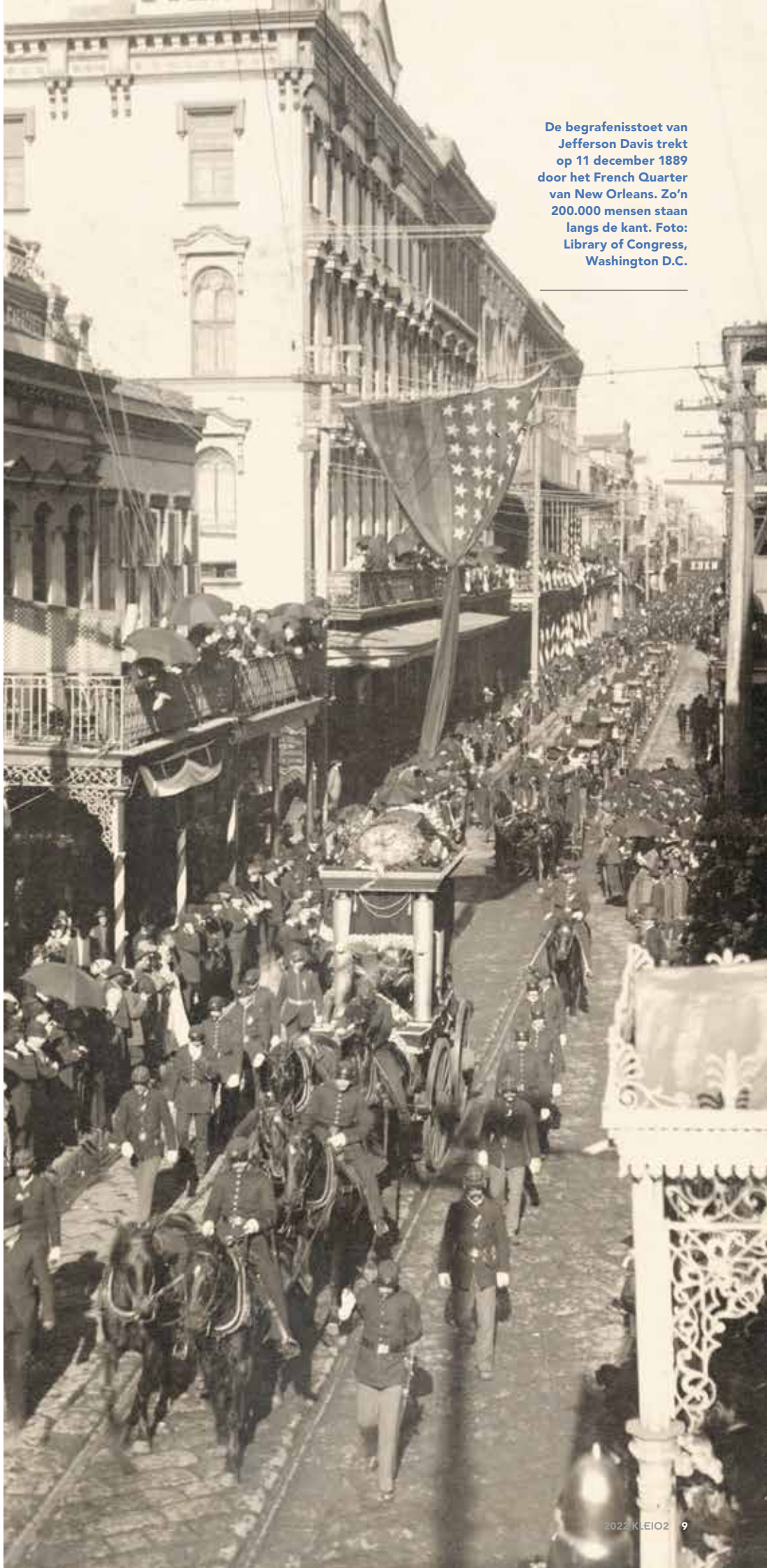
De begrafenisstoet van Jefferson Davis trekt op 11 december 1889 door het French Quarter van New Orleans. Zo'n 200.000 mensen staan langs de kant.