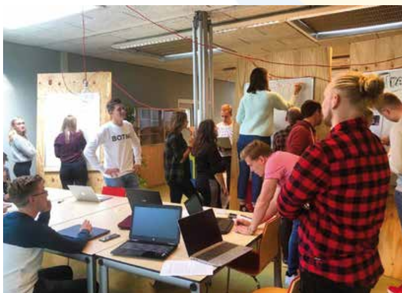
TC1-studenten brainstormen in leerteams over een eigen gekozen maatschappelijk vraagstuk.

wijs of het basisonderwijs wordt op het Teachers College een jaar uitgesteld. Je krijgt ruimte om van beide te proeven, om daarna een keus voor een vo-vak, de pabo of wellicht allebei te maken. Zelf koos ik voor de richting tot docent Nederlands en het jonge kind in het basisonderwijs. Op het Teachers College word je zeker niet aan de hand meegenomen en vooral uit je comfortzone getrokken. Je moeten durven experimenteren en willen leren. Over het ongemak heen stappen en de onzekerheid aangaan. En dat is soms best wel spannend, maar samen met je studiegenoten in het veld en je coach dicht langs de zijlijn lukt dat elk jaar een beetje beter. ■