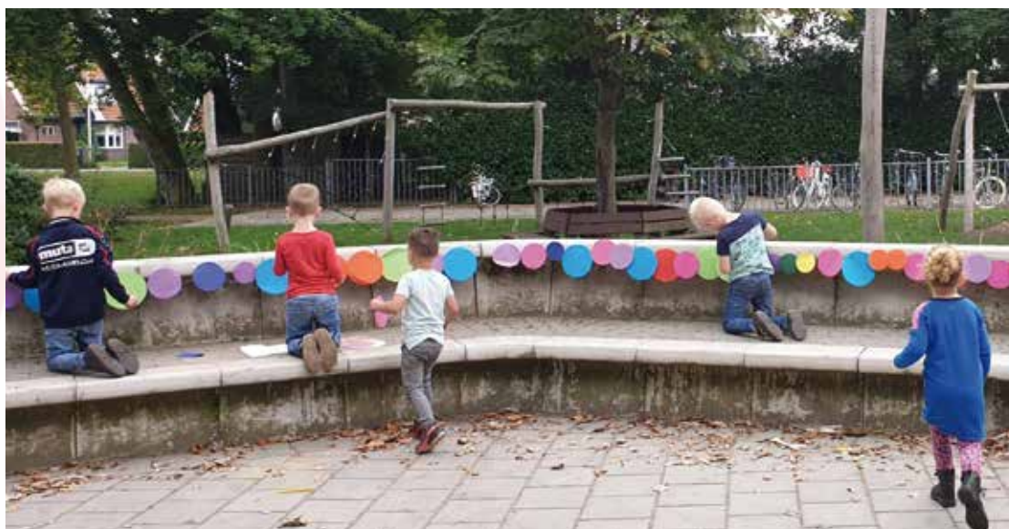
De kleuters van CBS De Es in Hellendoorn maken naar aanleiding van een les over kunstenaar Yayoi Kusama hun eigen 'happening' op het plein.

met wat ons op dat moment een betere docent kan maken, vanuit onze eigen talenten en interesses en met de unieke context waarin we ons bevinden. Moeten we dan echt alles zelf verzinnen? Nee, we worden natuurlijk wel onderwezen in een verscheidenheid aan onderwijsvisies en we leren werken met verschillende didactische theorieën. De verschillende leerclusters, zoals Pedagogy, Art Based Learning, Language Arts, Professional Skills and Identity, Change Leadership en Citizenship , geven ons een goede basis. Het leren binnen deze leerclusters komt altijd voort uit interactie met elkaar en de omgeving. Het volgen van een hoorcollege bestaat op het Teachers College dus ook niet. Als Teacher Artist sta je midden in de maatschappij. We halen de maatschappij in de klas