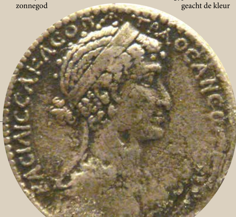
Tetrachme met afbeelding van Cleopatra (ca. 37-33 v.Chr.), Oostelijk Middellandse Zeegebied.