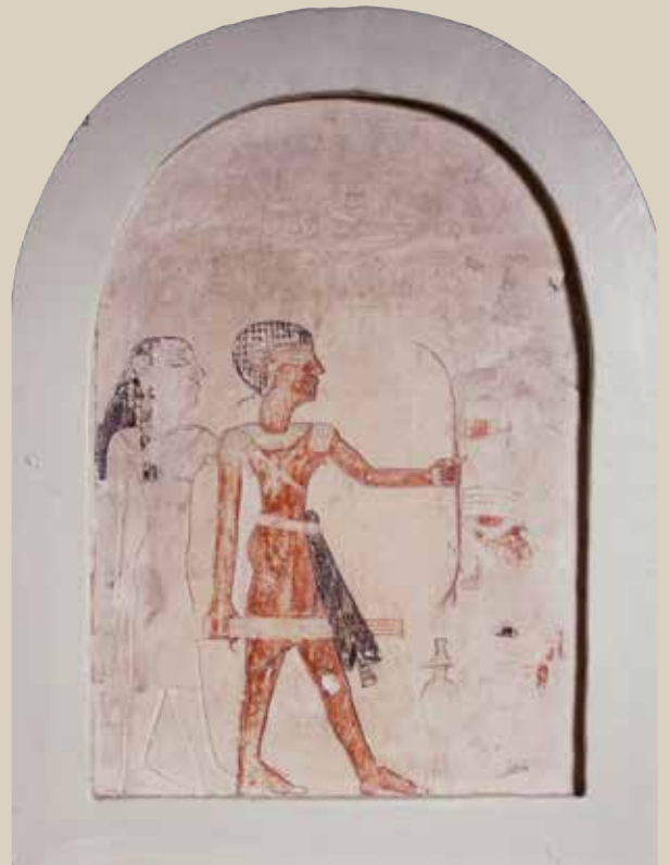
Daniel Soliman is conservator van de collectie Egypte bij het Rijksmuseum van Oudheden.

Het grondgebied van het oud-Egyptische koninkrijk kende bewaakte grenzen, maar deze verschoven vaak. Grensgebieden waren overgangszones van de ene cultuur naar de andere. Daarom kun je niet goed van één vastomlijnd, statisch oud-Egypte spreken. Toch bestond er in de sociale bovenlaag van de oud-Egyptische maatschappij altijd een idee over de Egyptische identiteit en werden er verschillende woorden gebruikt om het koninkrijk aan te duiden. Een van die namen was kemet , dat ongeveer 'het zwarte' betekent en verwijst naar de vruchtbare donkere grond langs de Nijl waarop de meeste nederzettingen stonden. Het was de tegenhanger van desjeret , 'het rode', de naam voor het veelal onbewoonde rotsachtige woestijngebied.