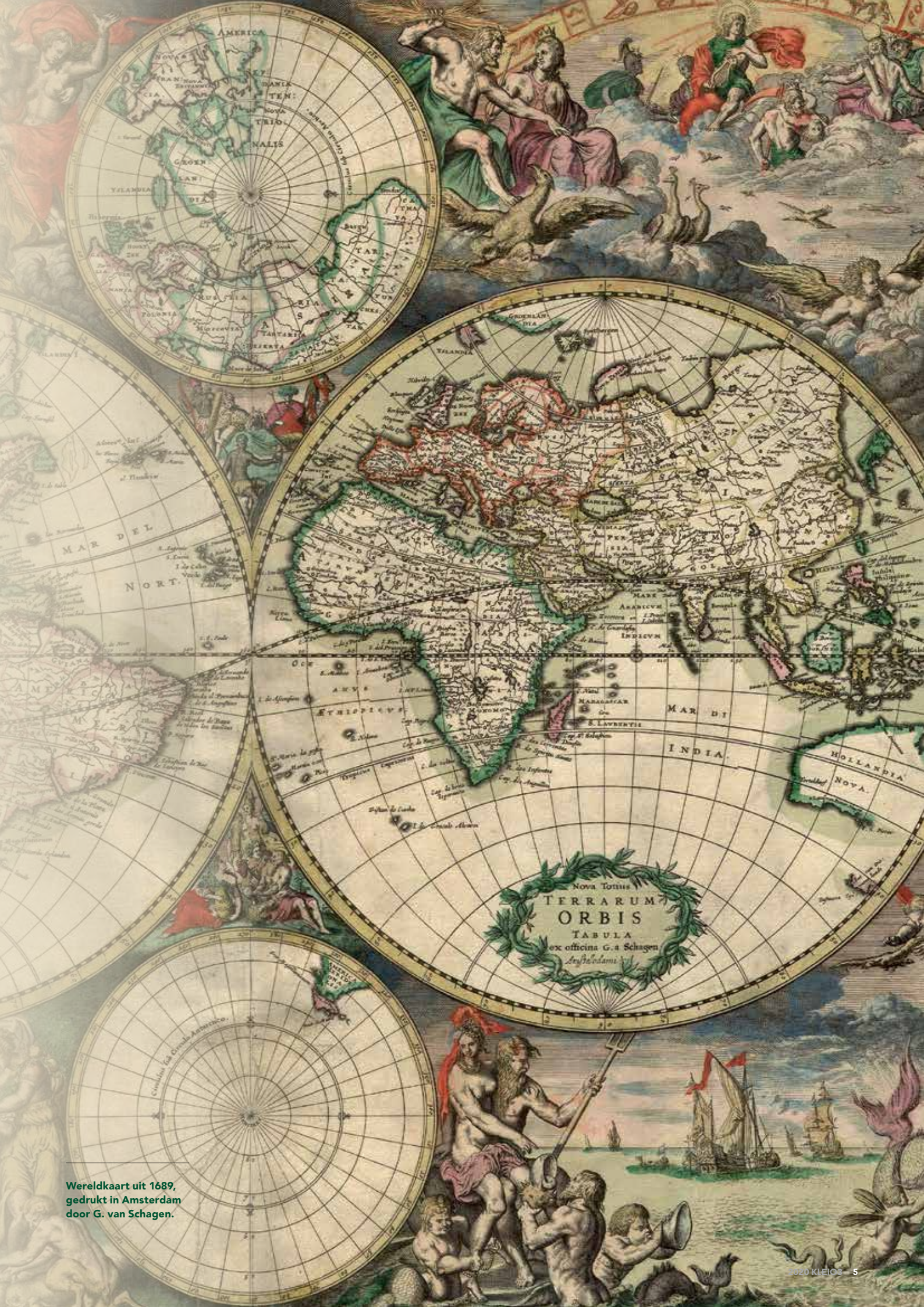
Wereldkaart uit 1689, gedrukt in Amsterdam door G. van Schagen.