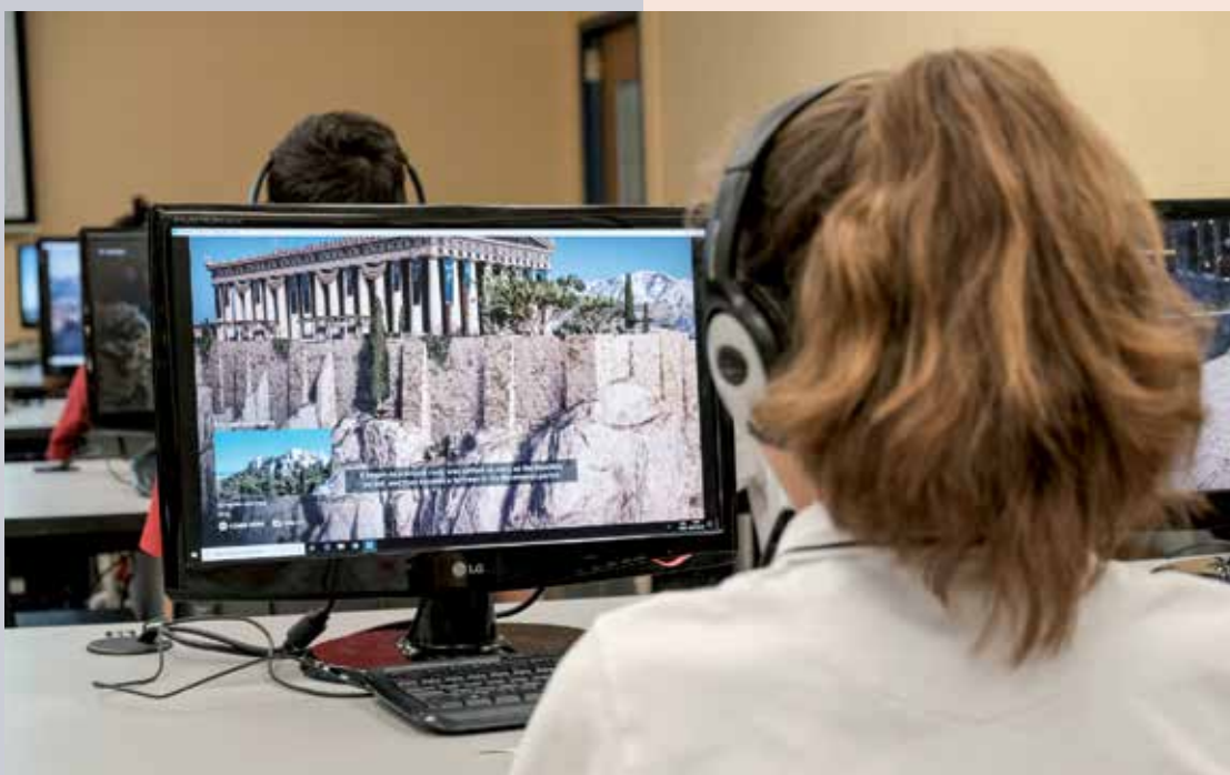
Leerlingen van het Collège Saint-Sacrement in Terrebonne, Canada, aan het werk met de Discovery Tour . Linkerpagina: Buste van Herodotus.