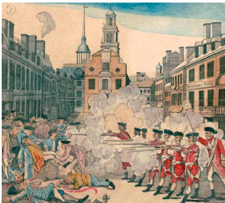
De Boston Massacre in 1770. Print van Paul Revere, kopie van het werk van Henry Pelham.

lood, verf en thee). De kolonisten in Amerika waren echter niet heel erg blij met deze maatregelen, die ervoor zorgden dat ze meer geld aan het moederland moesten afstaan.