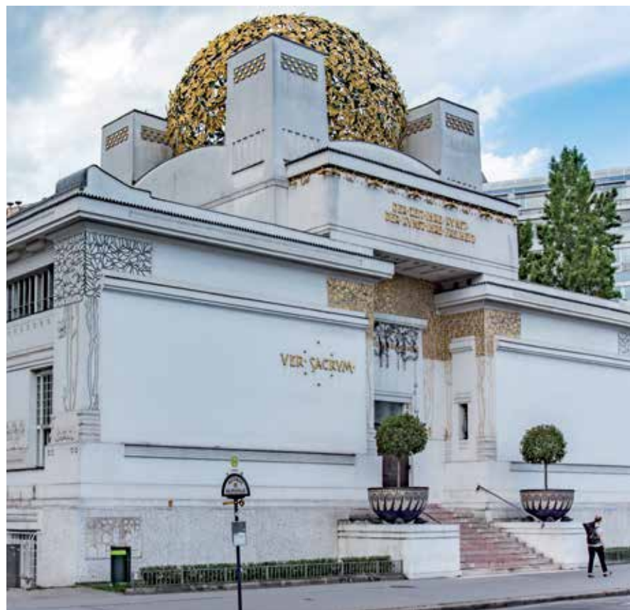
Rond de eeuwwisseling van 1900 ontstond de Jugendstil, waarvan de Secession in Wenen een mooi voorbeeld is.

De periode rond de eeuwwisseling van 1900. Het is een tijdvak van tegenstellingen en ambivalenties, van grootse verwachtingen en diepe angsten, vooruitgang en decadentie, van adembenemende ontwikkelingen in wetenschap en techniek, maar ook de ontdekking van het onderbewuste, de driften. Het is de periode van het moderne: in de muziek, kunst, literatuur. Dergelijke breukvlakken die alle maatschappelijke sferen betreffen zijn zelden in de geschiedenis.