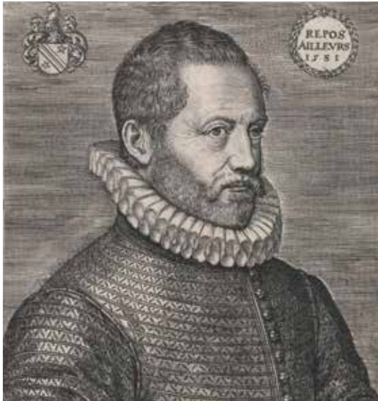
Portret van Filips van Marnix van Sint-Aldegonde. Prent van Johannes Wierix, 1581. Collectie Rijksmuseum.