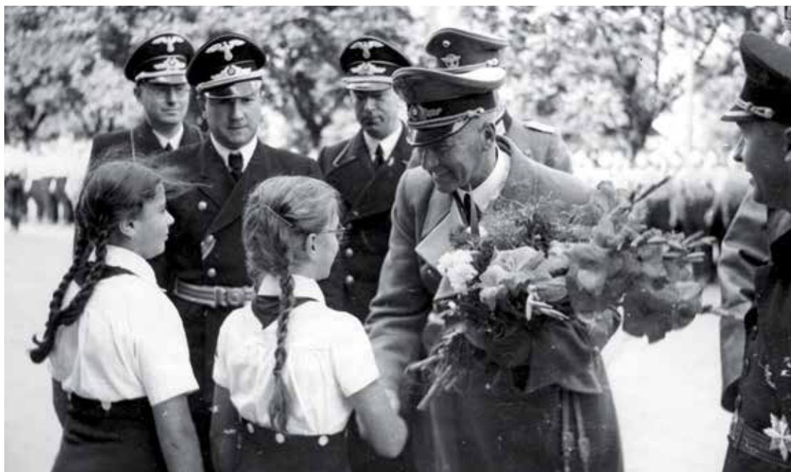
Adenauer benoemde Hans Globke tot chef van zijn Bundeskanzleramt, terwijl Globke een overtuigde nazi was geweest. Hier is hij te zien op een foto uit 1941, links achteraan, achter minister van Binnenlandse Zaken Wilhelm Frick bij een bezoek aan Slowakije.

In de Koude Oorlog hadden veiligheid en defensie voor Adenauer prioriteit, en dat betekende voor hem: Westbindung . Pogingen van de Sovjet-Unie om Duitsland zo min mogelijk in het Westen te laten integreren – zoals de Stalin-nota in 1952, waarin de Sovjetleider een Duitse eenwording