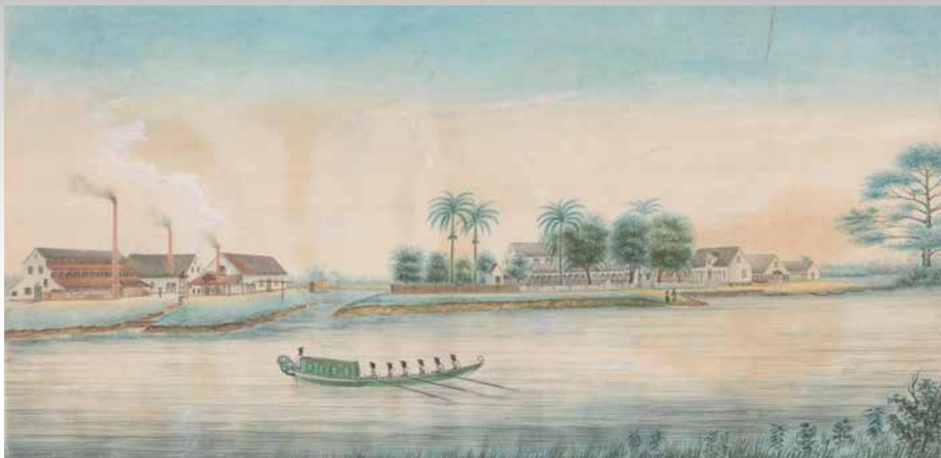
De suikerplantage Catharina Sophia gezien vanaf de Saramaccarivier. Tekening van Alexander Ludwich Brockmann, circa 1860. Collectie Rijksmuseum Amsterdam.

heen gaan en kwam regelmatig in verzet, zoals bijvoorbeeld in de residentie Cirebon (in het Nederlands Cheribon), waar bewoners het werk neerlegden om met duizenden hun beklag te gaan doen bij de resident. Ze zouden pas weer terugkeren naar hun dorp en werkzaamheden als het hogere gezag hun eis van verlichting van taken in de suikercultuur had ingewilligd. Ze vingden echter bot.