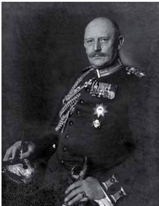
De Duitse opperbevelhebber Von Moltke, omstreeks 1910.

Zoals eerder gezegd: elk plan staat of valt met de bekwaamheid van de bevelhebbers om met tegenslagen om te gaan. Die tegenslagen hadden in 1914 nog vaak hun oorsprong in de gebrekkige communicatiemiddelen, waarbij berichten meestal fysiek werden overgebracht door ordonanssen. Hierdoor was het moeilijk om een juiste inschatting van de situatie te maken. In het