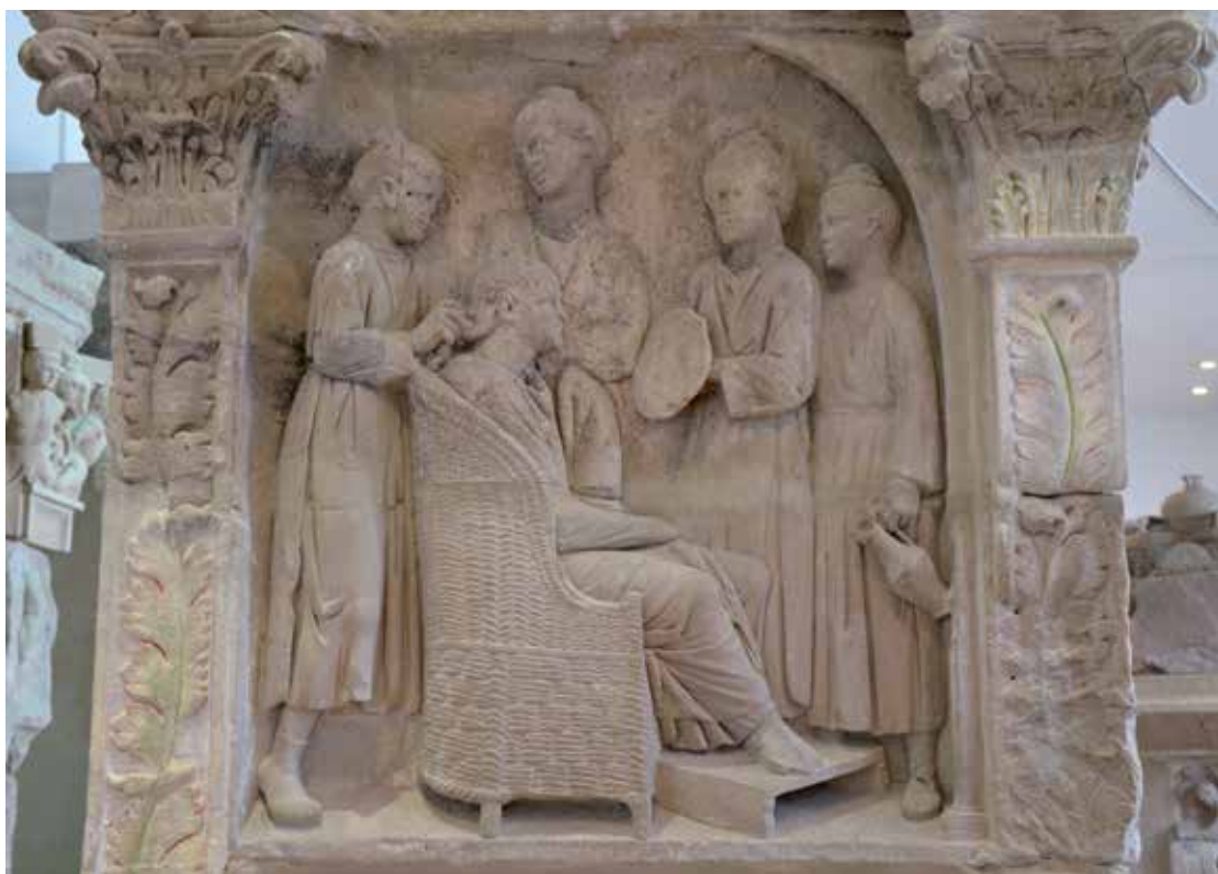
Vrouw wordt geholpen door vier slaven tijdens haar ochtendritueel, ca. 220 v.Chr. Foto gemaakt door Carole Radato in het Rheinisches Landesmuseum Trier.

Dan zijn er nog de geografische en sociale factoren die Bradley aanhaalt. De geografische positie van de slaaf in het Romeinse Rijk bepaalde in zekere mate de vooruitzichten op vrijlating, omdat buiten Rome de beschikbaarheid van magistraten