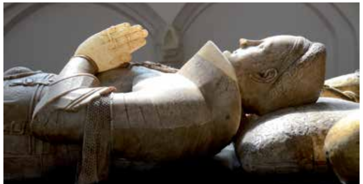
Graf van hertog Karel van Gelre, ook bekend als Karel van Egmond, in de Arnhemse Eusebiuskerk. Karel van Gelre probeerde tijdens zijn heerschappij de stedelijke macht in te perken.