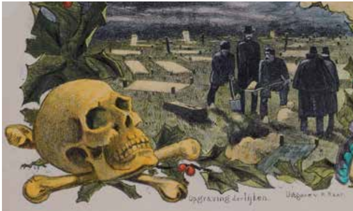
Het opgraven van de lijken. Detail uit litho van Roelof Raar (1885).

om geneeskundige hulp te halen. Artsen kwamen sowieso nauwelijks bij zieken in arbeidersbuurten. Het verklaart in belangrijke mate waarom Goeie Mie zo lang met haar misdaden weg heeft kunnen komen. Mie vergiftigde in de periode 1877-1883 65 mensen. De slachtoffers die na hun vergiftiging een arts hebben gezien, zijn op één hand te tellen.