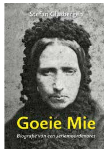
Goeie Mie. Biografie van een seriemoordenaar. Stefan Glasbergen (Primavera Pers, Leiden 2019), 160 blz., € 19,50

De strafzaak beheerste het nieuws maandenlang en Mie werd wereldberoemd. In Leiden is ze dat nog steeds, maar daarbuiten zijn we haar een beetje vergeten. Dat is jammer. Haar geschiedenis is een sensationeel en meeslepend verhaal over een verschrikkelijke moordenaar. Dat vonden haar tijdgenoten al, die als een soort ramptoeristen naar het huis van Mie gingen om te zien waar de moordenaar gewoond had. Dit overigens terwijl haar echtgenoot en kinderen daar gewoon nog woonden. Nog belangrijker is echter dat ze ons een venster biedt op de tijd van de industriële revolutie en dan in het bijzonder op de omstandigheden waar arbeiders in leefden. Zaken als armoede, honger en kinderarbeid zijn voor onze leerlingen vaak abstracte begrippen. Mie is iemand waar je jezelf mee kunt identificeren. Een gewone vrouw, die je zo op straat zou kunnen tegenkomen. Als we door haar ogen naar de ellende van de negentiende eeuw kijken, wordt dit soort problematiek een heel stuk concreter. ■