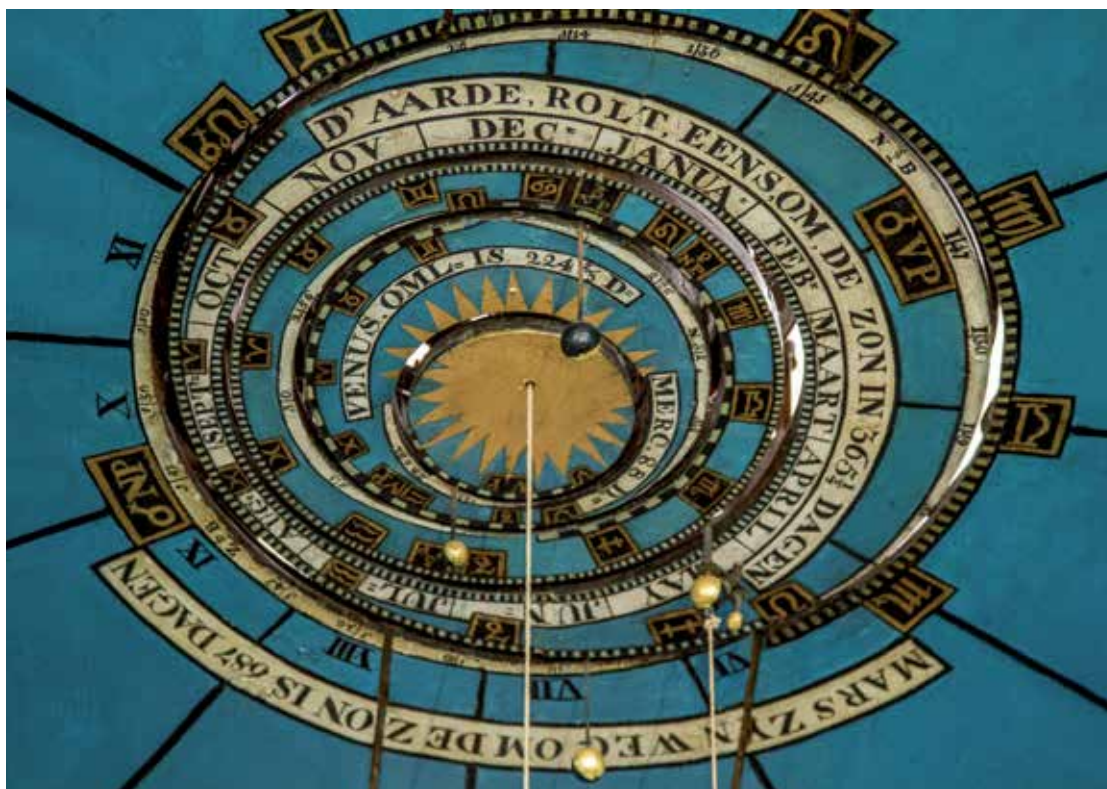
Planetarium van Eise Eisinga in Franeker. Deze astronoom wordt gezien als een voorbeeld van de Nederlandse verlichting.

historici daarom nogal wat filosofische elementen over in hun verhaal. Helaas wordt daarbij niet altijd goed overdacht hoe de historische en filosofische aspecten zich tot elkaar verhouden. In hoeverre is het achttiende-eeuwse denken nu precies fundamenteel voor onze samenleving, en in hoeverre is het louter een willekeurige episode in de cultuurgeschiedenis? En wat is precies de oorsprong van deze zogeheten verlichte ideeën? Dit zijn grote vragen, maar ik wil toch proberen er enig licht op te werpen, natuurlijk in een zeer ruwe schets waaruit allerlei nuances en complicaties zijn weggelaten.