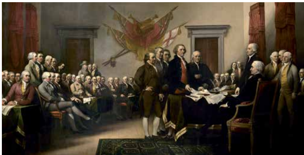
Schilderij dat het ondertekenen van de Amerikaanse Onafhankelijkheidsverklaring moet afbeelden. Geschilderd door John Trumbull in 1819.

gebied toch overeenstemming konden bereiken. De staat en seculiere denkers realiseerden zich dat deze nieuwe taal ook op andere terreinen een alternatief kon bieden voor het denken in morele en religieuze termen. Religie bood een gesloten wereldbeschouwing en sloot daarbij per definitie andersdenkenden uit. De nieuwe wetenschap beperkte zich tot dingen waarmee iedereen in principe kon instemmen. Door wetenschap tot het discours voor het openbare leven te verheffen en godsdienst te verplaatsen naar het privédoein, kon iedereen op gelijke voet lid van de samenleving zijn. Uit deze cocktail van elkaar versterkende elementen groeide wat we nu de verlichting noemen: een deels uit nood geboren, deels door politieke opportuniteit ingegeven beweging om de samenleving opnieuw in te richten op een niet-confessionele basis. Ideeën waren daarbij belangrijk, als inspiratiebron of ter legitimering. De verlichting werd echter niet alleen vormgegeven door schrijvers en filosofen, maar ook of vooral door ministers, regenten, juristen, en anderen die praktische hervormingen doorvoerden.