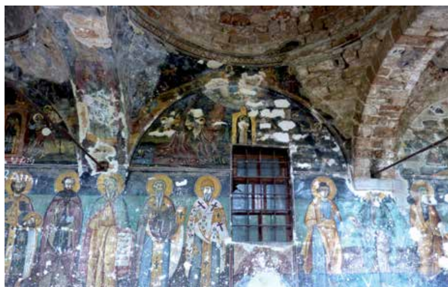
Een gehavende christelijke muurschildering in een voormalig kerkgebouw in Voskopojë in Albanië.

De val van de piramidefondsen in Albanië in de jaren negentig en de maatschappelijke en politieke context waarin die plaatsvonden. Tegelijk ben ik benieuwd hoe de dictatuur van Hoxha doorwerkt in het Albanië van na de val van het communisme. Ik ben inmiddels begonnen aan dit historisch onderzoek en heb nog een jaar de tijd om het onderzoek af te ronden, want dan verhuis ik weer met het gezin, vanuit Tirana (terug) naar Amsterdam.