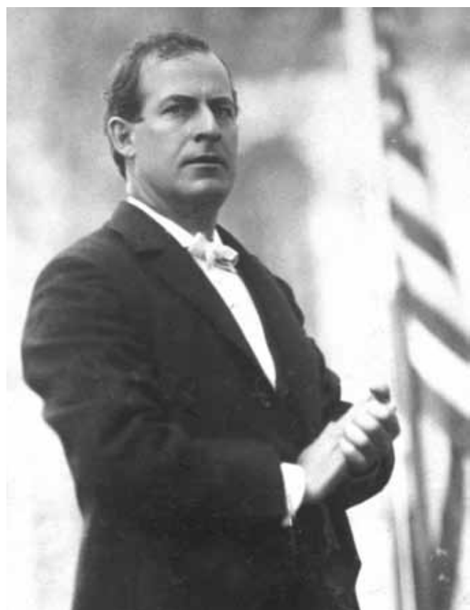
William Jennings Bryan tijdens een toespraak als presidentskandidaat voor de Democraten, 1896.

Een les van deze jaren is dat je niet per se verkiezingen hoeft te winnen om de politiek te beïnvloeden. De opkomst van de Populisten, de coalitie van boeren, arbeiders en andere ontevreden burgers, overtuigde de zakenwereld van de gevaren van massale onrust. Voor het eerst klonk de roep om een activistische overheid, drong het besef door dat de federale overheid nodig was om de slechtste kanten te temperen van een bandeloos kapitalistisch systeem. De gewone burger gaf weinig om de zilverobsessie van de Democraten. Hij wilde bescherming tegen uitbuiting door spoorwegen, banken, trusts en monopolies, en stond open voor pleidooien om pakhuizen, graansilo's, spoorwegen en telegraaf- en telefoonondernemingen in overheidsbezit te nemen. Het was overduidelijk dat er iets moest gebeuren aan de politieke, sociale en economische arrangementen in Amerika.