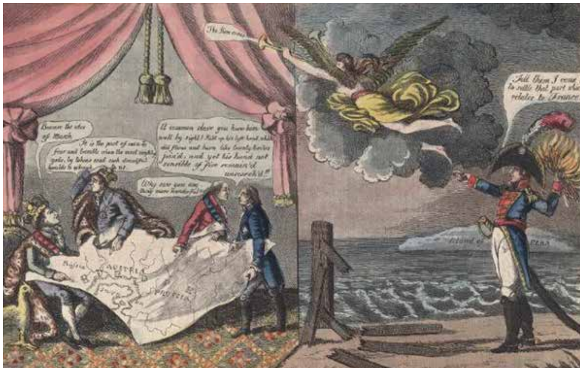
'Het congres van Wenen in grote consternatie.' Links de geallieerden met een kaart van Europa. Een engel kondigt Napoleons ontsnapping uit Elba aan. Het hek dat Napoleon moet tegenhouden, met daarop de tekst 'Louis XVIII' is gebroken. Spotprent uit 1814.

bij eigenlijk alle landen van Europa waren uitgenodigd, maar acht landen waren de hoofduitnodigers, en van die acht deelden eigenlijk vier de lakens uit. In de eindfase van de strijd tegen Napoleon, in 1814-1815, was een nieuwe hiërarchie uitgekristalliseerd. De landen, Rusland, Pruisen, Oostenrijk en Engeland, benoemden zichzelf als eersterangs mogendheden. Al in 1805 correspondeerde de tsaar met William Pitt, de Britse premier, over de contouren van die nieuwe naoorlogse orde. Dat was het stuk dat de Britse minister van Buitenlandse Zaken, Castlereagh, in 1815 opnieuw verspreidde. Frankrijk zou tijdelijk bevoegd worden, maar zou later wel weer tot de eersterangs mogendheden gaan behoren op grond van omvang, macht en politieke positie. De tweederangs mogendheden waren Spanje, Portugal, Zweden en Nederland. Er waren tot slot ook nog derderangs mogendheden, zoals Hessen of Zwitserland. Die landen mochten blij zijn dat ze nog overleefden na 1815 en niet waren weggeorganiseerd. In Wenen werd echter nog niet nagedacht over de concrete