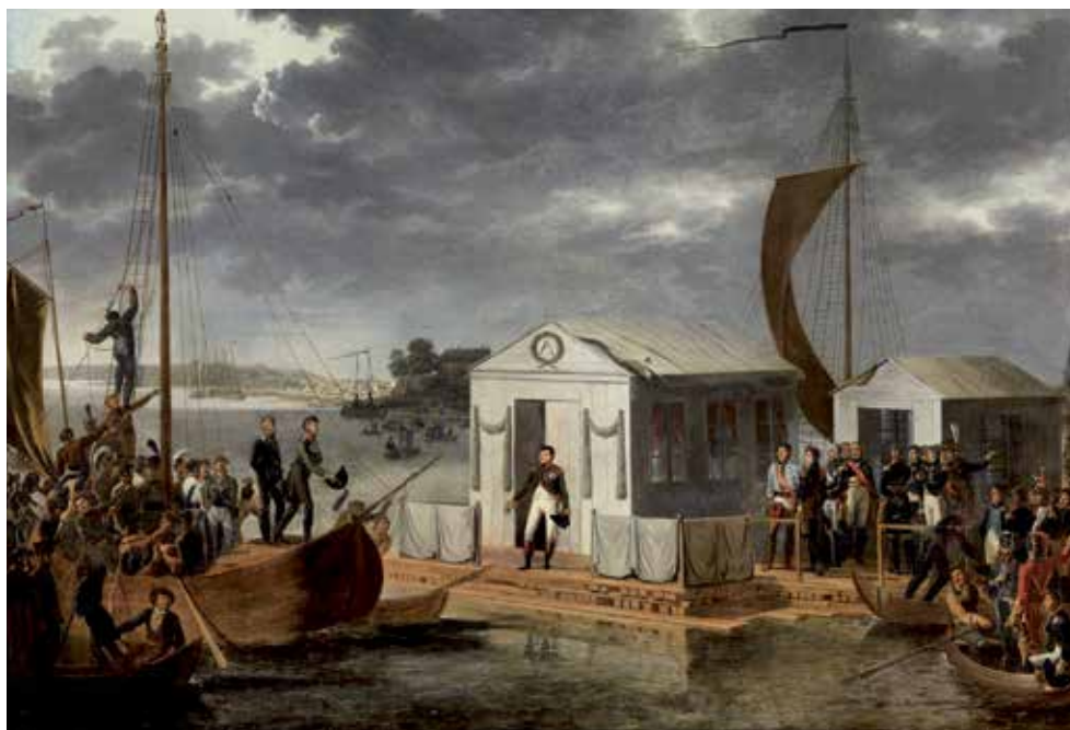
Tsaar Alexander I sluit de Vrede van Tilsit in 1807 met Napoleon Bonaparte op een vlot in de Memel, destijds een grensrivier tussen Rusland en Pruisen.

vooral gebruikt om de aanhangers van het Terreurbewind van Robespierre aan te duiden. Hoewel het begrip terreur al wél werd gehanteerd. Aanslagplegers kregen de benaming “assassijnen”. Toch begon de Geallieerde Raad vanaf 1816 vaker de begrippen assassins, radicalen en terroristes door elkaar te gebruiken. Het ging in alle gevallen om al dan niet vermeende aanhangers van het revolutionaire of het napoleontische bewind die zich met woord en daad keerden tegen het gevestigde gezag van Lodewijk XVIII of de geallieerden. Radicalen die echt een móórdaanslag wilden plegen noemde men dan assassijnen. Veel veteranen uit het napoleontische leger, in het bijzonder de officieren op half soldij, waren gefrustreerd over hun ontslag. Sommige begonnen na te denken over een aanslag op Wellington, een aantal gevluchte Franse radicale schrijvers waren in Brussel neergestreken en deden mee aan de samenzwering. Het is lastig te bepalen of die samenzweringen serieus waren, of dat ze vooral door de politie werden opgeblazen. Feit is dat er wel een samenzwering was, dat er dreigbrieven werden verstuurd en dreigementen wer-