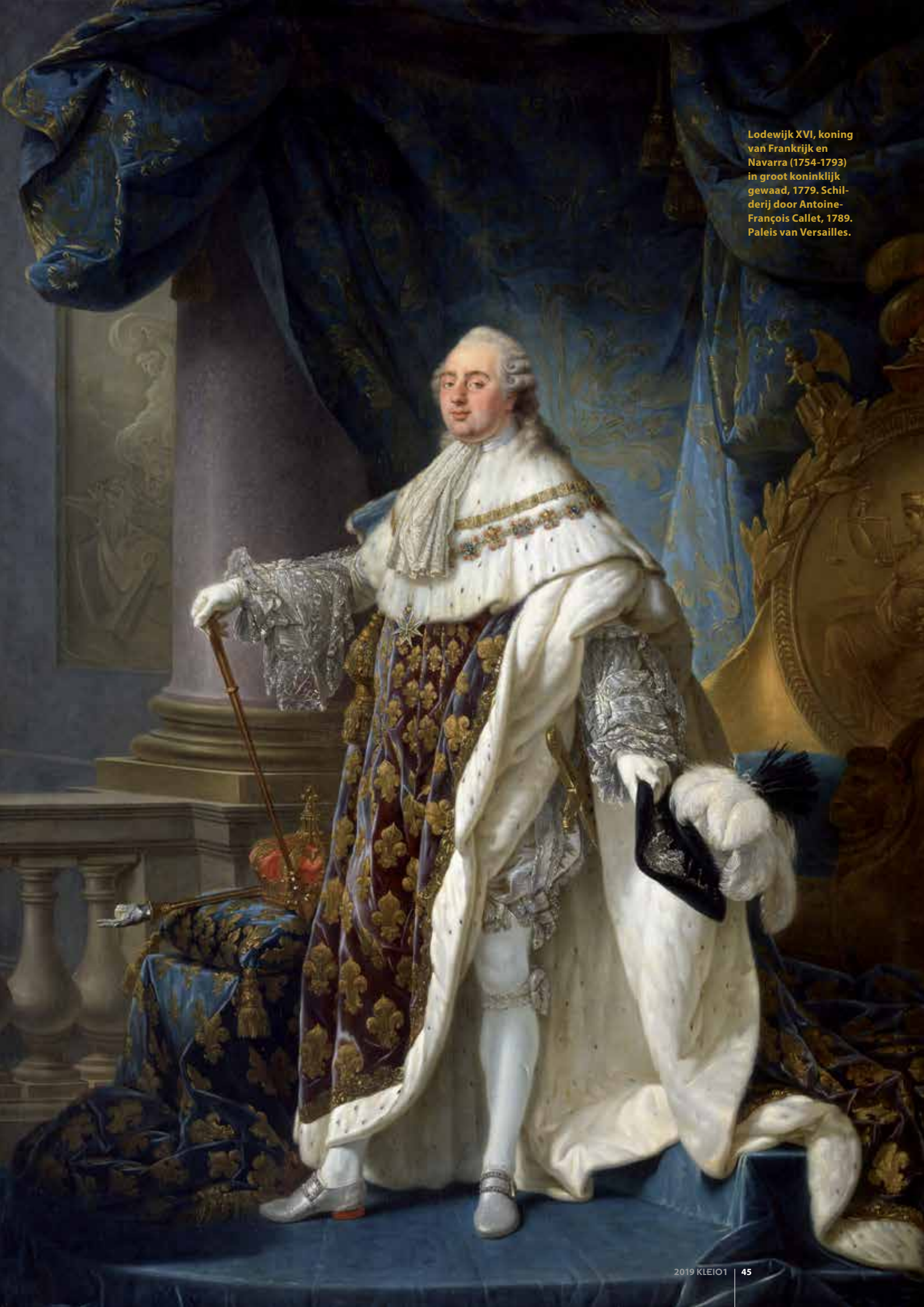
Lodewijk XVI, koning van Frankrijk en Navarra (1754-1793) in groot koninklijk gewaad, 1779. Schilderij door Antoine-François Callet, 1789. Paleis van Versailles.