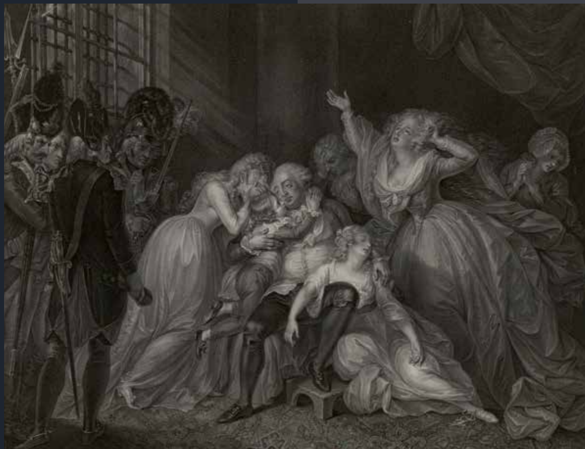
Lodewijk XVI neemt afscheid van zijn familie. Engelse gravure door P.W. Tomkins met een opdracht voor de Prins van Wales, 1795.

B. Verheijen , Geschiedenis onder de guillotine. Twee eeuwen geschiedschrijving van de Franse Revolutie (Vantilt, Nijmegen 2013).