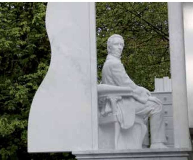
Beeld van Thorbecke gezeten aan zijn bureau. Het beeld staat op het Lange Voorhout in Den Haag.

In de Nederlandse context voelde Thorbecke zich vanaf zijn Duitse periode een vreemde, hij miste de mogelijkheid om met iemand 'aus der Seele' te kunnen spreken en ervoer dit als 'Entbehrung' en 'tiefen Schmerz', zoals hij aan de bevriende classicus Karl Müller schreef. Aerts kent nauwelijks betekenis toe aan het feit dat Thorbecke, als hij vrij man was geweest, de voorkeur aan een geleerdenleven in het Duitse taalgebied had gegeven. Door de financiële nood moest hij echter wel een betrekking in Nederland aanvaarden, die hem van zijn 'liefste studiën' afhaalde, de filosofie. In Nederland werd hij twee keer afgewezen voor een hoogleraarspost filosofie, vanwege zijn vermeende spinozisme. Dit zich ▶