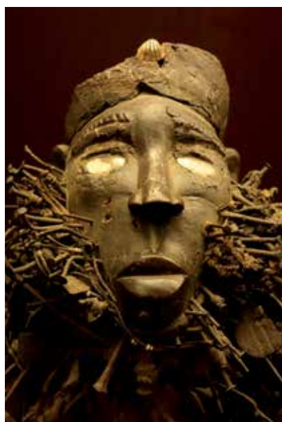
Een nkisi nkonde (Congolees spijkerbeeld, niet de in het interview genoemde).

Het bekijken van een nkisi nkonde, een Congolees spijkerbeeld waaraan geneeskracht werd toegeschreven.