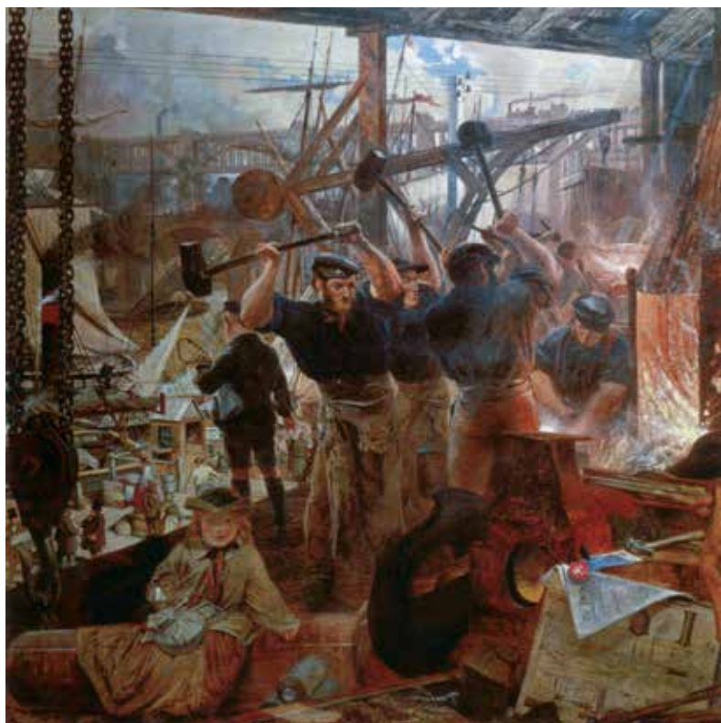
Boven: Arbeiders aan het werk, door William Bell Scott, 1855-1860. National Trust, Wallington, Northumberland. Onder: Kool en ijzer staan aan de basis van de snelle industriële revolutie die Groot-Brittannië vanaf de achttiende eeuw door maakte.

Historicus Paul Kennedy heeft gesteld dat het Verenigd Koninkrijk deze politiek van bemiddeling en compromis ook richting de andere Europese grootmachten voerde. 5 Tevens dwongen allianties de Britten dit principe uiteindelijk overboord te zetten en samen met Frankrijk en Rusland ging het een anti-Duits bondgenootschap aan (Triple Entente, 1907).