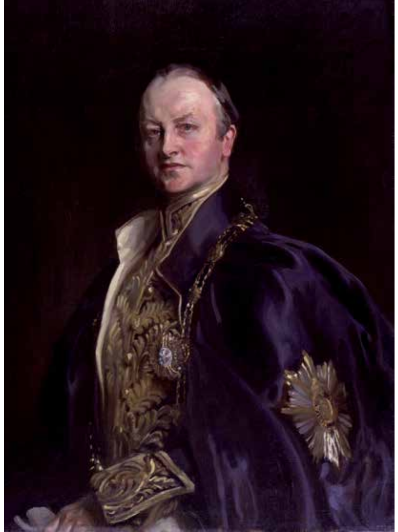
Lord Curzon, door John Singer Sargent, National Portrait Gallery, Londen.

die op luchtige wijze met de last van het wereldbestuur om kon gaan. Lord Curzon, onderkoning van India (1899-1905) was een goed voorbeeld van de keerzijde van deze zelfingenomenheid. Hij besteedde 50.000 pond aan een monument ter ere van de kort daarvoor overleden koningin Victoria, waardoor er geen geld was om de net