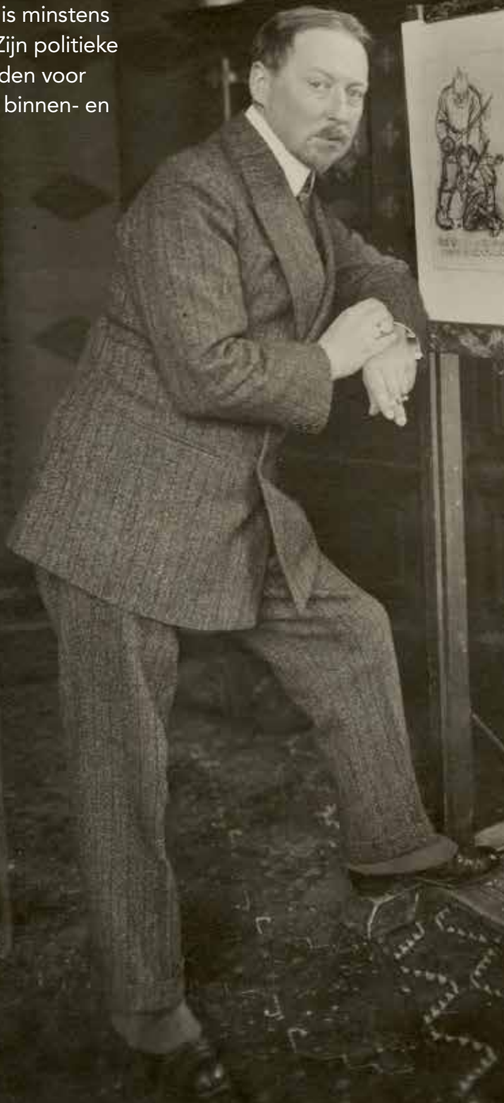
Louis Raemaekers, geportretteerd in zijn huis in Haarlem, december 1914.

De prenten van Louis Raemaekers worden veel gebruikt in lessen over de Eerste Wereldoorlog. De geschiedenis van de tekenaar zelf is minstens zo boeiend. Zijn politieke prenten zorgden voor veel ophef in binnen- en buitenland.