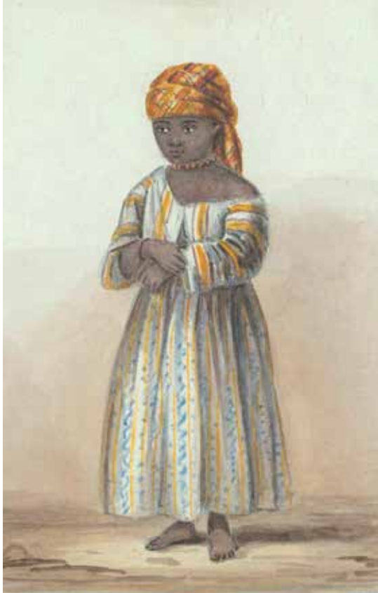
Links: Portret van Affie door Jacob Marius Adriaan Martini van Geffen, ca. 1859. Rijksmuseum Amsterdam. Onder: Omslag van de strip Quaco.

de negentiende eeuw, terwijl 'slavernij' doorgaans één paragraaf in de achttiende eeuw krijgt toebedeeld en in tijdvak acht geen rol meer lijkt te spelen. Benadrukt werd ook dat niet alleen leerlingen met een Surinaamse of Antilliaanse achtergrond behoefte hebben aan meer kennis van het Nederlandse slavernijverleden. Het is een geschiedenis die zij delen met 'witte' Nederlanders. De ervaring leert dat die laatsten daar wel degelijk voor openstaan. Stil Verleden legt daarnaast ook relaties met andere periodes en delen van de wereld.