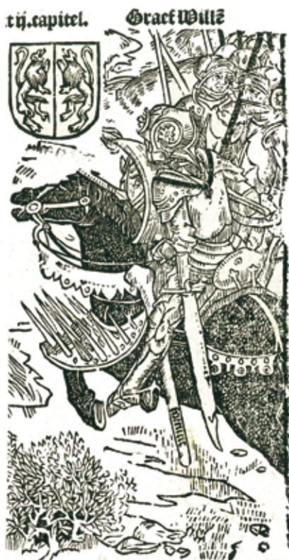
Graaf Willem 1 van Holland, illustratie uit Cronycke van Hollandt , uitgegeven door Jan Seversz, te Leiden in 1517 en 1530. Collectie Rijksmuseum.

Als je geen kennis van de geschiedenis hebt, kom je nooit te weten waarom je op een bepaalde plek op de wereld woont en hoe je familie daar terecht gekomen is. Dan loop je als een kip zonder kop door je leven en ben je een weerloos slachtoffer voor de consumptiemaatschappij en haar aanjager het neoliberale kapitalisme.