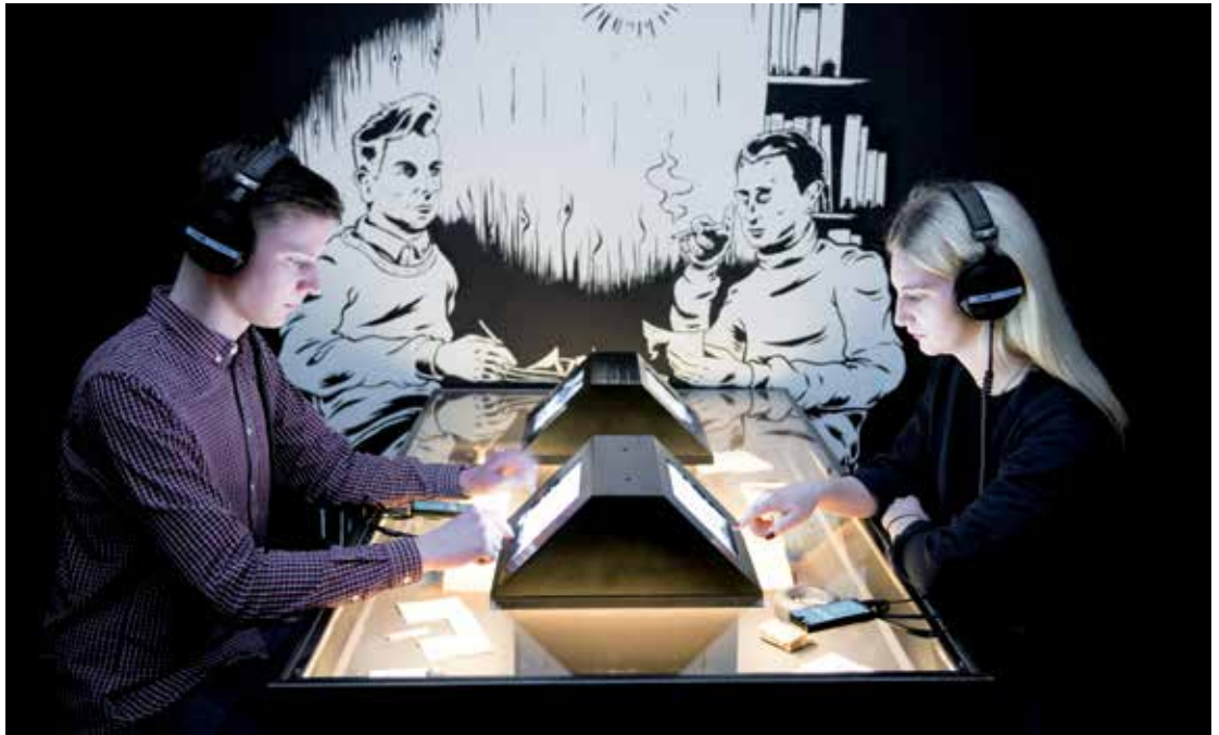
Foto van de tentoonstelling Explosiegevaar! Onder: Willem Arondéus in Explosiegevaar! Illustratie: Rob Worst.

zijn opgeslagen. Bij een controle is een telefoontje genoeg om erachter te komen of een persoonsbewijs vals is. Door het Amsterdamse bevolkingsregister in brand te steken, hoopt de groep rondom Arondéus het Duitse vervolgingsapparaat een effectief controlemiddel uit handen te slaan. Informatie als machtsmiddel – het is een actueel thema nu grote techbedrijven als Facebook en Google regelmatig een loopje nemen met privacyregels.