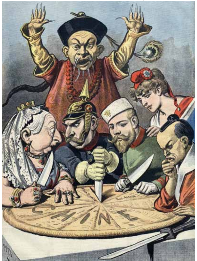
'China, de taart van koningen ... en keizers.' Franse politieke cartoon uit 1898. Koningin Victoria, keizer Wilhelm II, tsaar Nicolaas II, de Franse Marianne en een Japanse samurai verdelen de 'taart' van China. Een karikaturale ambtenaar van de Qing-dynastie probeert hen tevergeefs te stoppen.