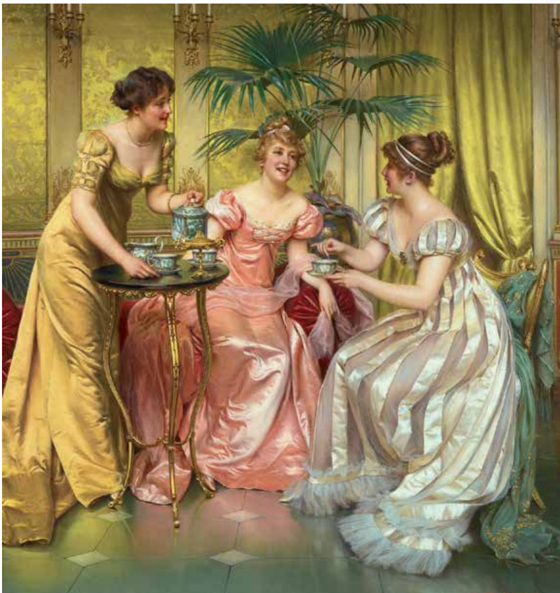
Theevisite in de negentiende eeuw. Schilderij van Frédéric Soulacroix.