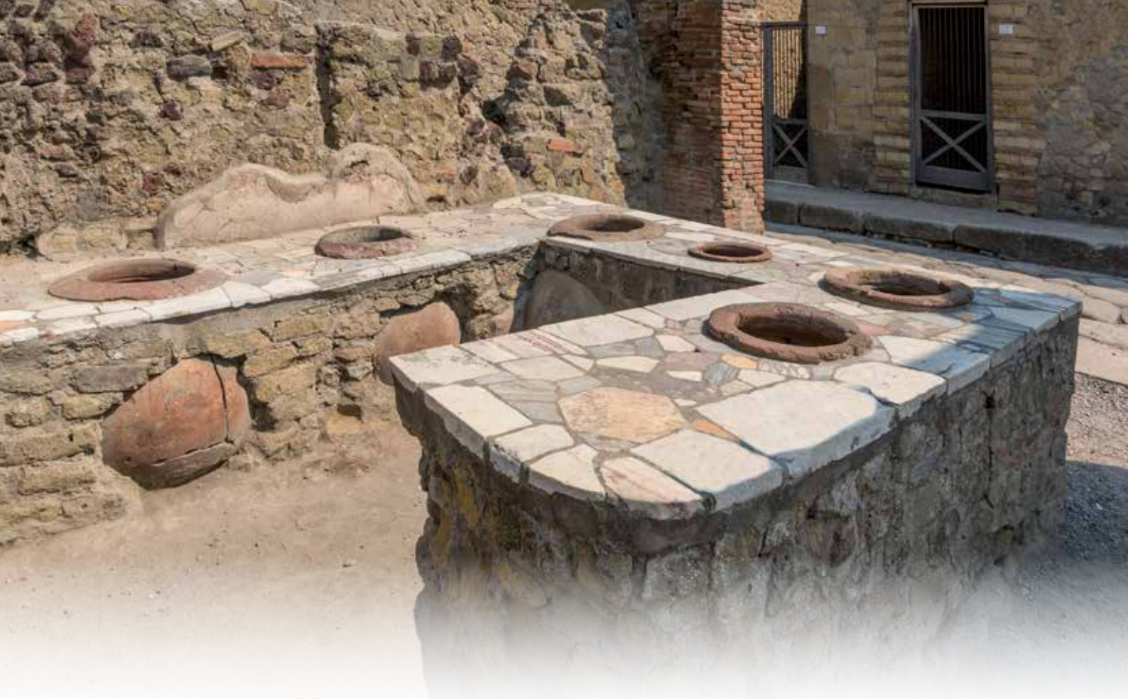
Een snackbar ( thermopolium ) in Herculaneum.