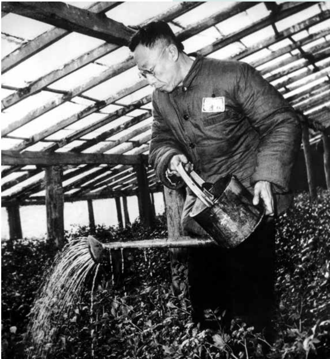
Puyi in 1959, als tuinman in Peking.

De wederopstanding van China. Van prooi tot wereldmacht (Prometheus, Amsterdam 2020), 228 blz., € 22,50