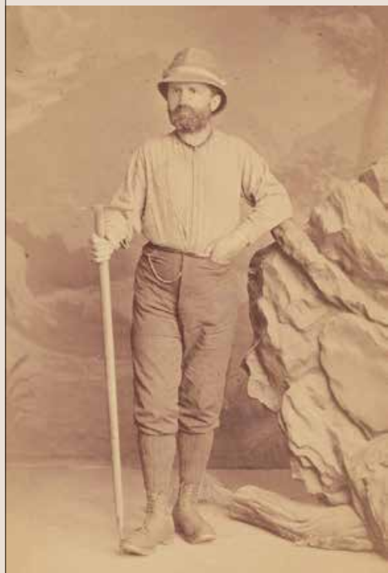
Abraham Kuyper tijdens een vakantie in Zwitserland. Foto uit Abraham Kuyper: A Pictorial Biography .

was, 'het compromis was niet zijn fort'. Zijn sleutelwoord in de strijd tegen het in zijn ogen elitaire liberalisme was 'calvinisme'. Dat hield voor hem 'vrijheid en democratie' voor 'de kleine luyden' in. De 'antithese' in de politiek was hem heilig. Je vraagt je tijdens het lezen meermalen af, waar het 'wonderkind' met 'tien hoofden en honderd armen' al zijn tijd vandaan haalde. Meer dan de helft van zijn leven oefende hij namelijk ook nog eens serieus het beroep van journalist uit. Als hoofdredacteur van de Standaard , het gereformeerde dagblad bij uitstek (ook door hem opgezet) zijn er maar liefst 17.000 driestarten (zijn kritische commentaren bij het nieuws) en 20.000 artikelen uit zijn vulpen gevloeid. Ook publiceerde hij in Franse bladen, een taal die hij als polyglot 'op hetzelfde niveau beheerste als het Nederlands'. Daarnaast legde hij zijn ziel en zaligheid in ongeveer 9.000 brieven, talloze boeken en wat al niet meer. Zijn archief in de kelder van de VU beslaat met 73 dozen een lengte van tien meter! Tja, en dan waren er nog twee min-