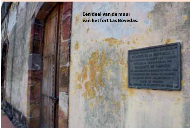
Een deel van de muur van het fort Las Bovedas.

Op het moment woon ik in Panama, in Casco Viejo, het oude centrum van de hoofdstad, door Spanjaarden gebouwd. Verschillende kerken stammen uit de zeventiende eeuw. Las Bovedas is de fortificatie die de buurt tegen de zee en de piraten beschermd. Als je daar overheen loopt zie je oude, rechte, Spaanse straten van Casco Viejo en in de verte de flats van het nieuwe Panama, die aan Dubai doen denken.