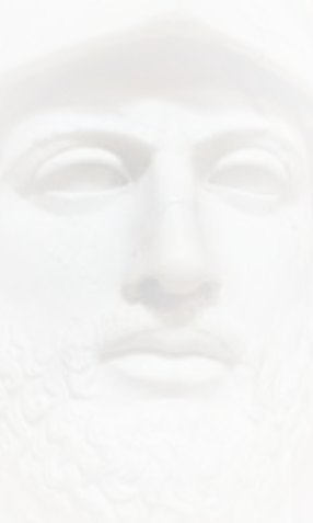
Ook Perikles zelf werd in een schervengericht genomineerd.