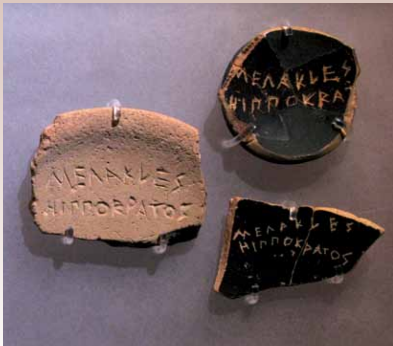
Op de scherven staan de namen van mensen die genomineerd waren om een jaar verbannen te worden uit Athene.

of uitgereikt – de naam van een politicus die hij beschouwde als bedreiging voor de democratie, met andere woorden als een aspirant-tiran. De Atheense volksmacht was immers ontstaan nadat een einde was gemaakt aan de tirannie van de zonen van Peisistratos. Op de agora stond een standbeeld van de tirannendoders, tyrannoktonoi , Harmodios en Aristogeiton, die Peisistratos' zoon Hipparchos in 514 uit de weg hadden geruimd, en daarbij zelf de dood vonden. Zoals bij ons op vrolijke momenten het Piet Hein wordt aangeheven, klonken bij Atheense drinkgelagen versjes op de illustere twee die 'de Atheners gelijkwettig' hadden gemaakt. Het bekendste slachtoffer van het ostracisme is Themistokles, nota bene de strateeg die de Atheners de overwinning in de zeeslag bij Salamis (480) had bezorgd. Uiteindelijk is het in de vijfde eeuw maar twintig keer tot een ostracisme gekomen. In het besef dat het ruwe systeem tot misbruik leidde, werd het niet meer gebruikt. Andere mechanismen – vervolging wegens volksmisleiding – kwamen in de plaats. Hier toonde de Atheense democratie zich, in moderne managerstermen, een lerende organisatie. Dat is kenmerkend voor de ware democratie. Anders dan totalitaire systemen is zij nooit af. Dat maakt haar superieur, want terwijl het spel om de macht wordt gespeeld kunnen de spelregels door de spelers worden veranderd: een gekozen burgermeester, een referendum of waarom geen dagelijkse algemene volksvergadering via de computer?