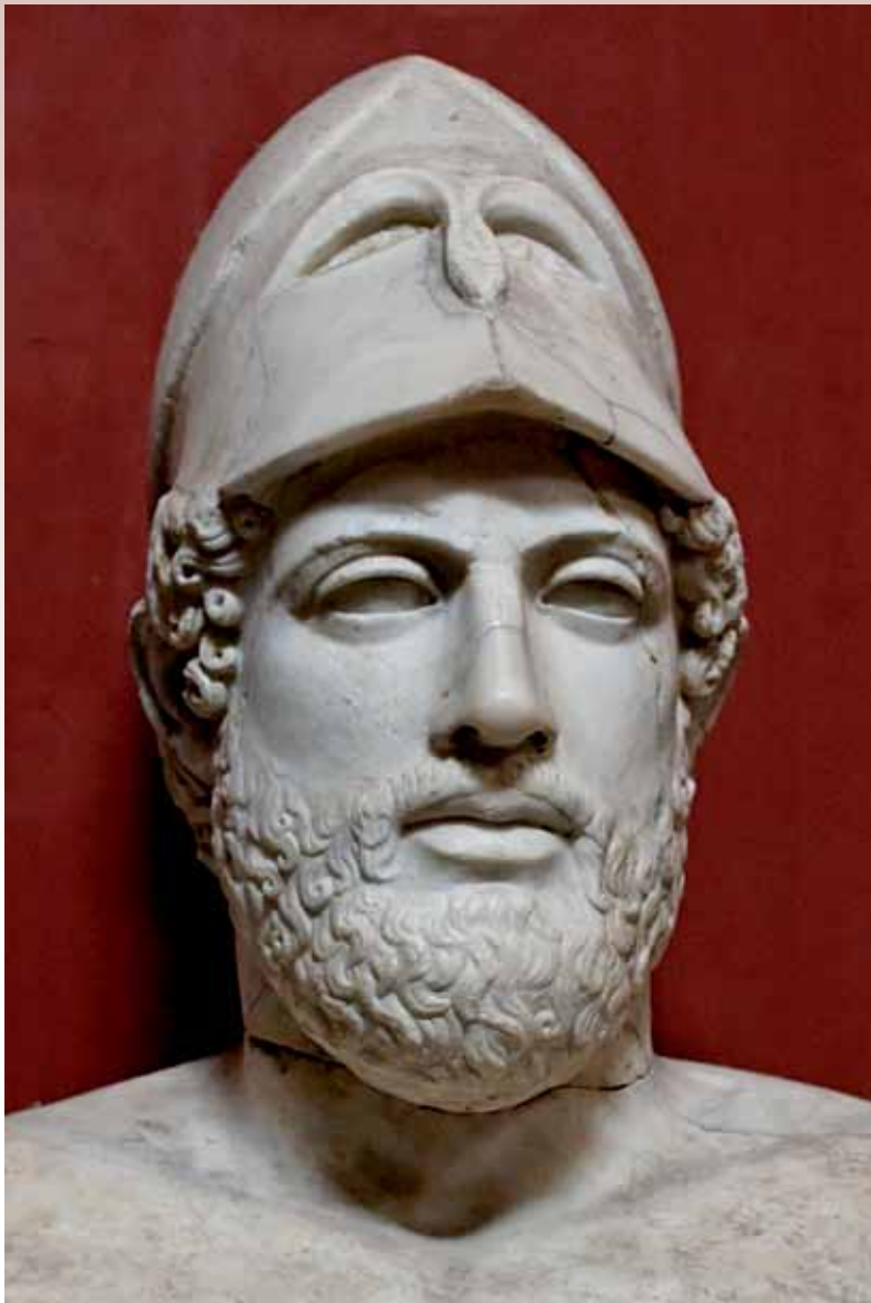
Marmeren buste van Perikles. Bron: Vaticaanse Museum.

staten bij het verlagen van de census dat aandeel kiezers.