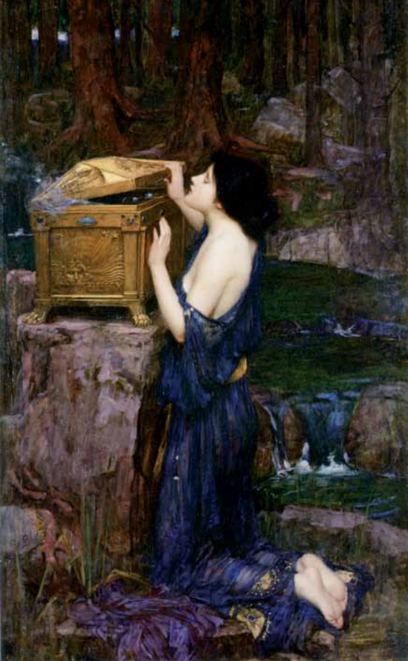
Pandora opent de doos. John William Waterhouse, 1896.

heid aan. Zeus laat dat over aan de broers Epimetheus en Prometheus. Uit water en aarde maken zij de dieren en de mensen. Die moeten dan nog eigenschappen krijgen waarmee ze kunnen overleven en Epimetheus krijgt na lang aandringen toestemming van zijn broer om dat onderdeel van de schepping te verzorgen.