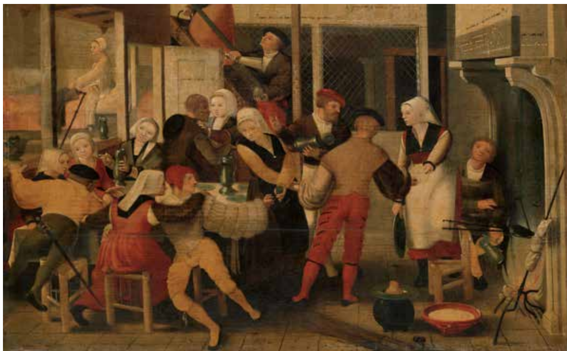
Gezelschap in een bordeel , door (het atelier van) Brunschwigse Monogrammist, ca. 1540. Rijksmuseum Amsterdam.