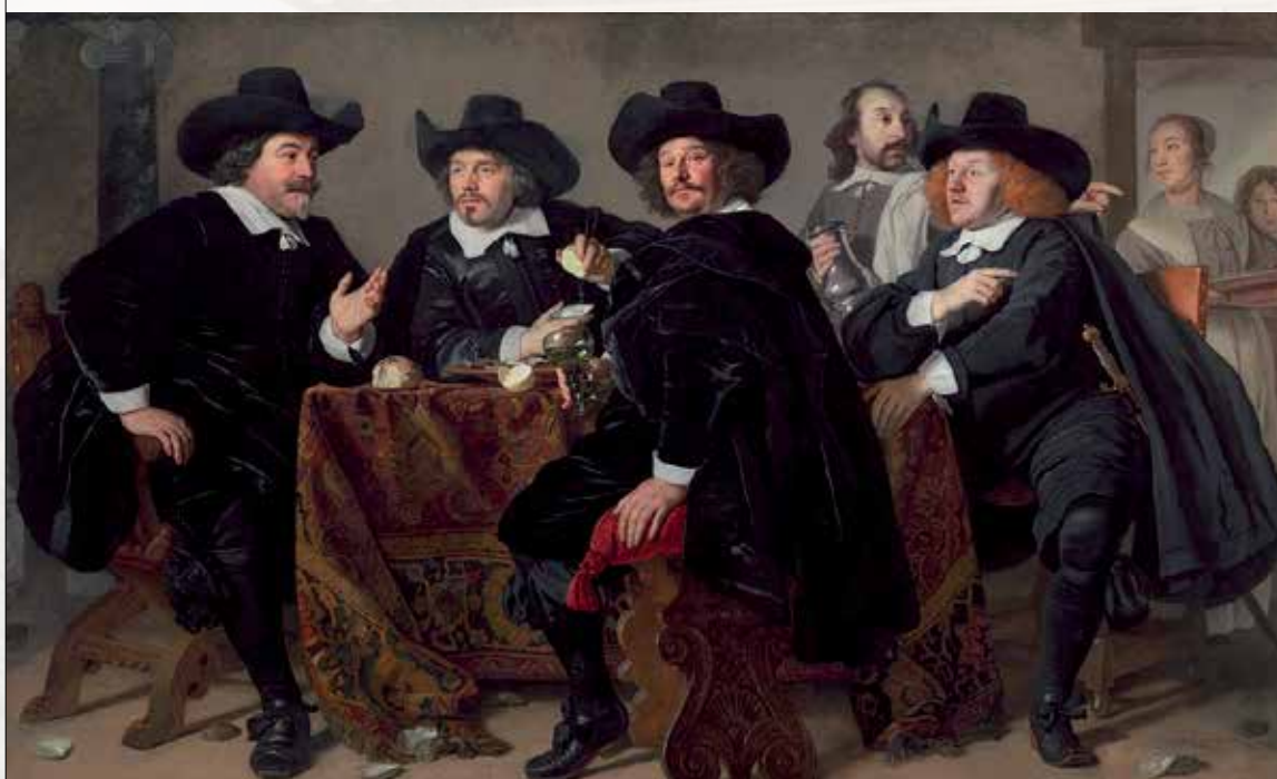
Een van de doelenmeisjes aan het werk in de Kloveniersdoelen (rechts). De overlieden van de Kloveniersdoelen door Bartholomeus van der Helst, 1655. Amsterdam Museum.

Het personeel van de doelenherbergen kwam zelden uit Amsterdam. Ook uitbaatsters en personeelsleden van andere drankhuizen hadden meestal een migratieachtergrond. Om zelfstandig te mogen tappen moesten zij het poorterschap verwerven door koop of een huwelijk met een burger. Ongeveer een derde van de tappende nieuwe poorters was vrouw. Aanvankelijk kwamen de nieuwkomers vooral uit de Zuidelijke