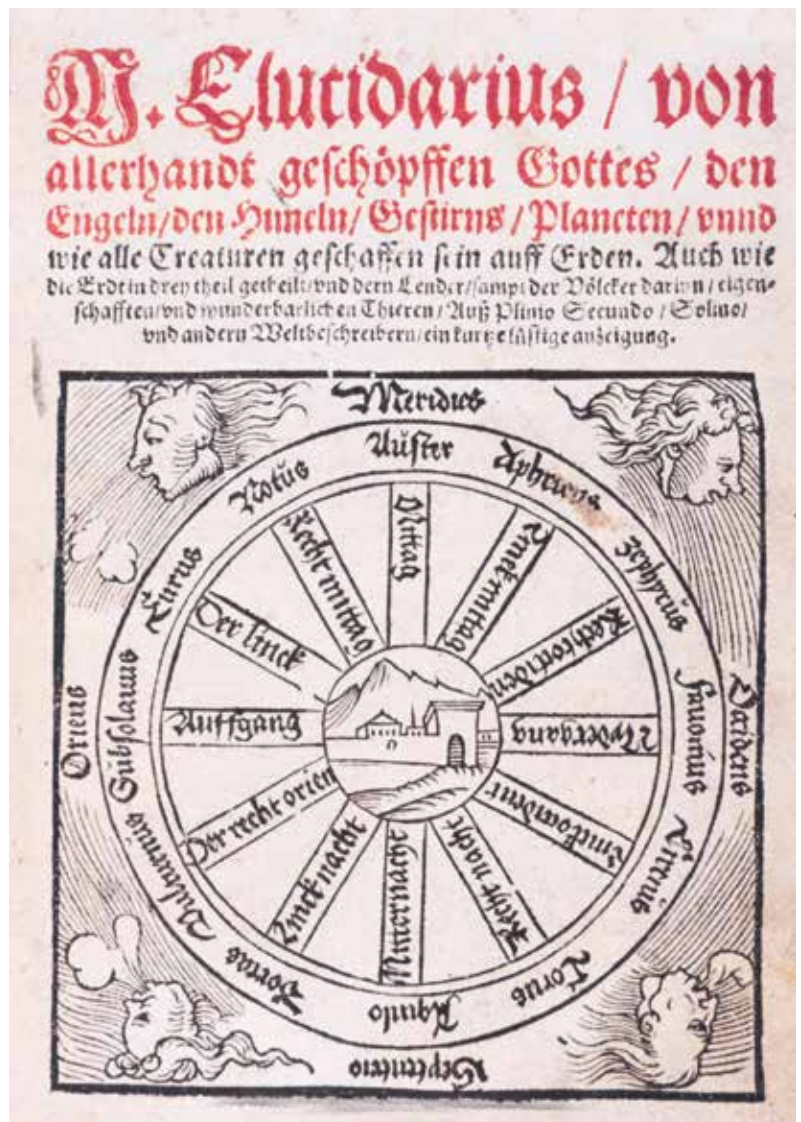
Een Duitse versie van het Elucidarium uit 1559. Op de titelpagina staat een kompasros met de namen van de twaalf winden.

Een middeleeuwse vraagbaak bevat de Artes-Lucidarius. Die naam wordt gebruikt voor de Middelnederlandse vertaling van de Duitse Lucidarius, die gebaseerd is op het Elucidarium met als aanvulling allerlei aardrijkskundige, natuurwetenschappelijke en liturgische kwesties. Klunder: 'De Duitse Elucidarium-vertaling stamt uit het eind van de twaalfde eeuw. Tot aan het