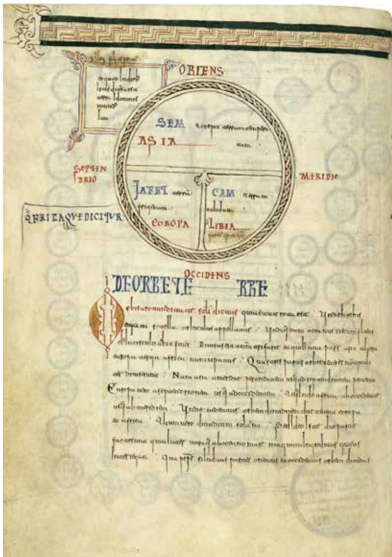
Een OT-kaart uit de Roda Codex, ca. 990. Deze schematische wereldkaarten hebben meestal het oosten, dus Azië, boven.